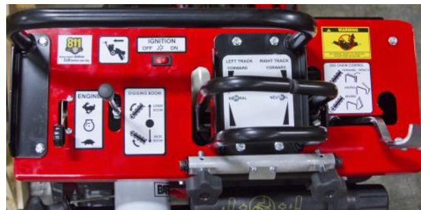
Panel Sólido y Sencillo