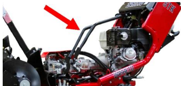
Sin Cables de Transmisión